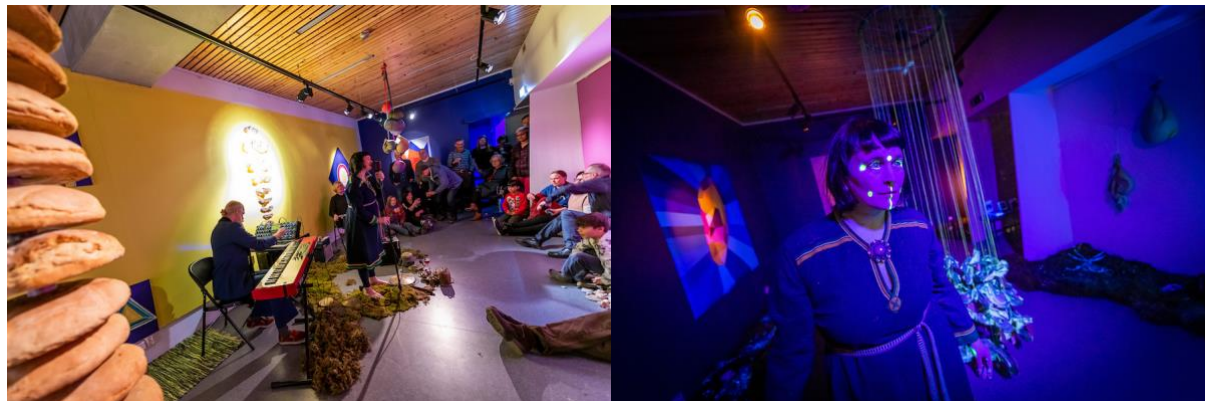
Fra åpningen av utstillingen En usunget sang / Lávllukeahkes lávlla.

https://nordligefolk.no/sjosamene/kunst-musikk-litteratur/marita-isobel-solberg/