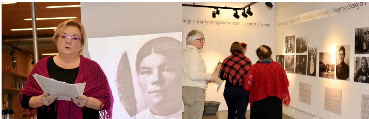
Fra åpningen av utstillingen Kvinner i Nord-Troms . Foto: Torun Olsen Wernberg

Nord Troms museum satte opp utstillingen på Markedsplassen, Skibotn, i juni 2019.