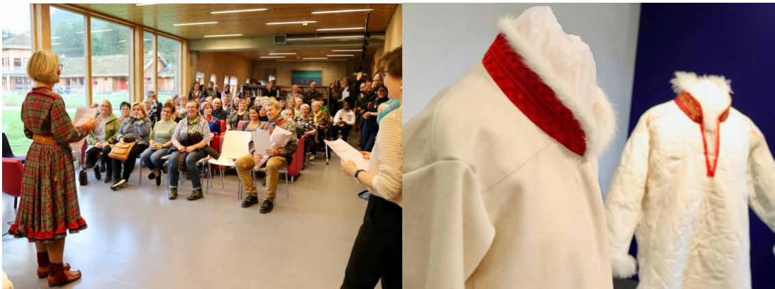
Fra åpningen av utstillingen riebangolli / kråkesølv.

https://senterfornordligefolk.no/apning-av-utstilling-riebangolli-krakesolv-i-samisk-klestradisjon/