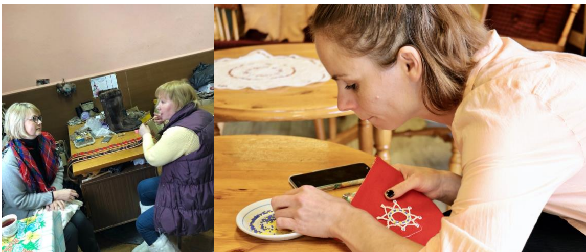
Fra prosjektet Duodji over grenser .

Prosjektet er støttet av Barentssekretariatet.