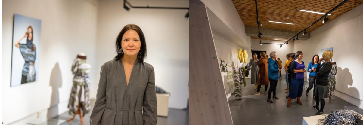
Fra åpningen av utstillingen Den samiske halvtimen.